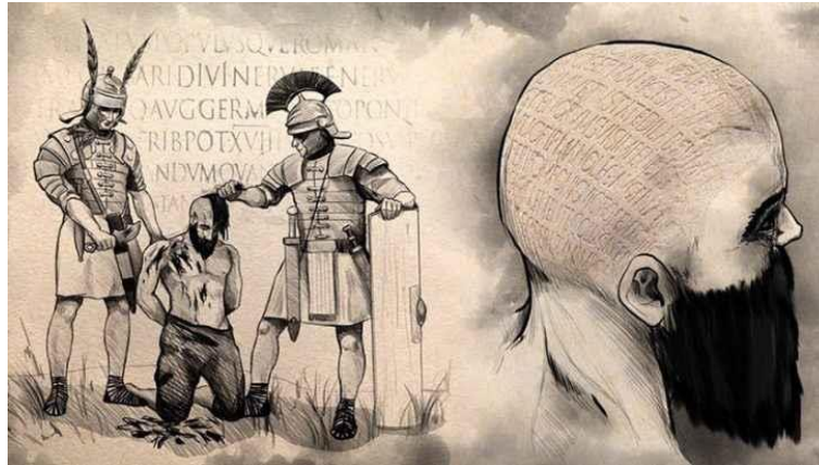
Slika 1. Brijanje glave i čitanje urezanog teksta [1]

Postojali su i bolniji načini prijenosa podataka, urezivanje na tijelo čovjeka prenositelja poruke. Obrijali bi mu glavu, urezali poruku i čekali da kosa naraste. Poslali bi glasnika i na odredištu ponovo bi mu obrijali glavu da bi mogli pročitati poruku. Nedostatak ovakvog načina prenošenja poruka: dugotrajan proces dok kosa ne naraste i jednom urezana poruka ostaje uvijek urezana. Ovaj način komunikacije često se koristio u Grčko – Perzijskim ratovima.