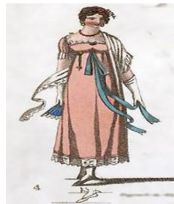
Slika 3. Skrivanje kuglice odjećom [3]