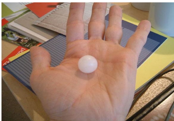
Slika 2. Primjer voštane kuglice tajnog sadržaja [2]

Vosak, kao kemijska tvar, često se koristila pri prenošenju skrivenih podataka. Nije bitno da li se koristio pčelinji vosak ili lanolin, vosak dobiven pranjem ovčje vune. Njegova fizikalna svojstva omogućila su široku primjenu u Kini. Vosak pri 20°C je u čvrstom stanju, dok pri 40°C tali se i prelazi u tekućinu. Navedene promjene agregatnih stanja Kinezi su iskoristili na dvojak način: izradili bi šuplje kuglice od voska i u njih umetnuli pisane poruke, te kuglice zatvorili voskom. Jednostavniji način je bio da se koristi svila kao podloga za pisanje poruka. Poruka na svili uroni se u tekući vosak, oblikuje u kuglice i ostavi na hlađenje. Ohlađena kuglica nosila se na vidljivom mjestu, kao modni dodatak. Nije privlačila pozornost, jer je bila sastavni dio odjevnog predmeta.